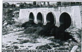
Ergene Nehri'ni Türkiye'nin en kirli akarsuyu.