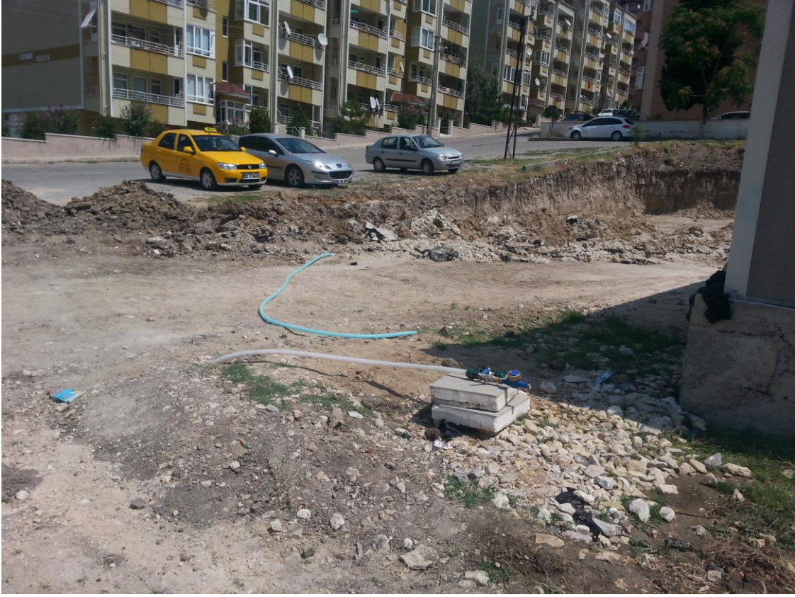
28-Alt yapı çalıřmaları sonrası çevre düzenlemesi ve ıslak zemin çalıřmaları başlatıldı.